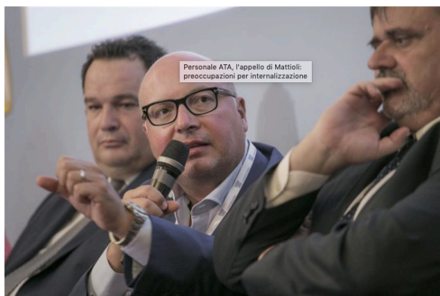
Personale ATA, l'appello di Mattioli: preoccupazioni per internalizzazione